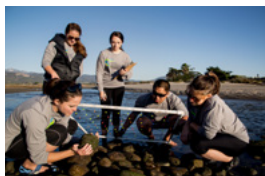
プロジェクトに参加した学生たち