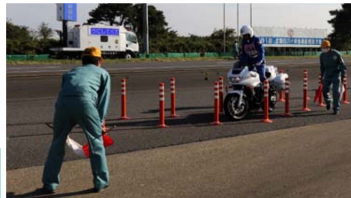
大会1日目に公開競技として実施されたバランス走行操縦競技（女性の部）