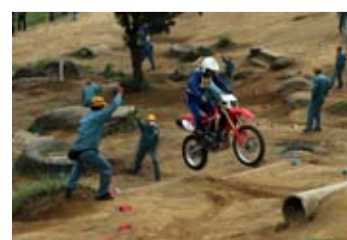
トライアル走行操縦競技（男性の部）