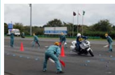
バランス走行操縦競技（男性の部）