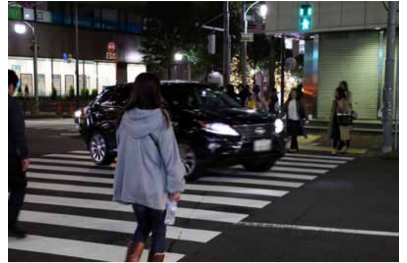
歩行者がいるにもかかわらず、一時停止して歩行者保護を行わないクルマ

また、道路横断歩行者妨害により取締りを受けた件数は18万1,290件で昨年より3万5,000件以上増えて過去最多となっている。道路交通法では、横断歩道等を横断し、または横断しようとする歩行者等がある時は、その手前で一時停止し、その歩行者等の通行を妨げないようにしなければならないと規定している。ドライバー・ライダーがこれを遵守すれば、信号機のある交差点での事故は防げるはずだ。