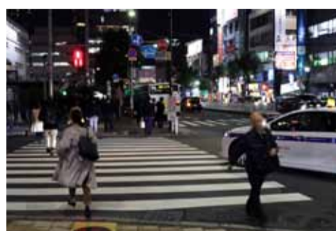
赤信号になってから横断を始める歩行者