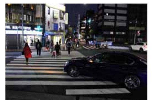
歩行者が渡り終えるのを待ちきれず、横断歩道へ徐々に進入するクルマ