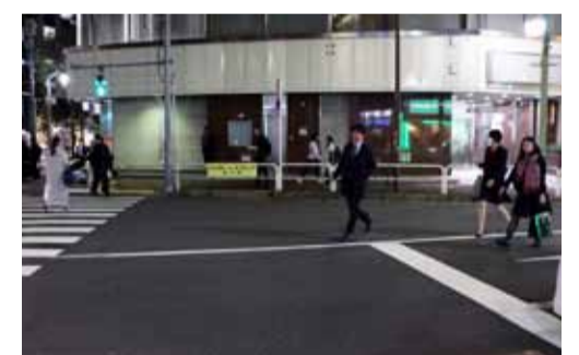
道路を斜め横断する歩行者