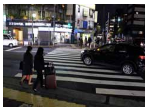
歩行者を避けるために、交差点を大回りして左折するクルマ