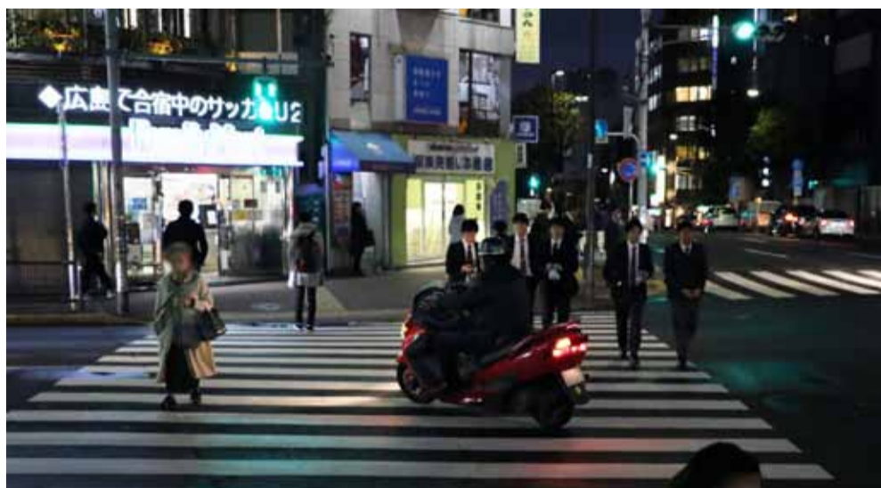
横断している歩行者の顔を横切るバイク

に横断歩道を渡り始める。そのため、この時に左折しようとする車両は歩行者が途切れるまで、横断歩道の手前で停止せざるを得ない。そして、歩行者が少なくなると、車両は歩行者を優先せずに通過しようとする。高齢者と思われるドライバーが運転する乗用車が左後方を確認せず左折したため、歩行者が立ち止まる場面や、歩行者が途切れるのを待ちきれず、横断歩道上の歩行者へ徐々に近づいていく場面があった。高齢者に限ってみると、歩行者保護をしないドライバーの割合が多かった。また、歩行者と歩行者の間を通過する二輪車もいた。一方で、トラックの多くは横断歩道の手前で一時停止し、渡ろうとする歩行者がいなくなるまで待つて通過していた。