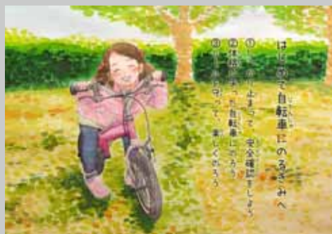
ポスターの部・大賞