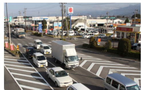
右折・直進車線は混雑しているが、塩尻I.C.に向かう左折車線は空いている

「高出和手」交差点で発生した事故のほとんどはCから来たクルマが右折する際、Dから来た直進車と衝突するケースだ。ここは右折禁止になっているため、直進車が右折してくるクルマの存在を予測するのは難しい。そのため、右折禁止場所で右折することはたいへん危険な行為といえる。古いカーナビではCからBへの右折を誘導してしまうこともあるようだ。また、直進車の中にも信号が赤になってから交差点へ進入してしまうクルマが少なくなかった。ドライバーは道路標識や信号に注意を払うなど周囲の状況をよく観察するべきだ。