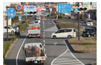
交差点周辺で転回や横断は頻繁に行なわれている