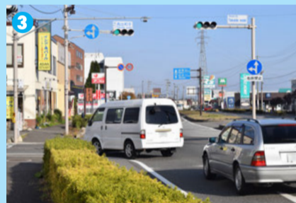
CからAへ向かうクルマの多くが左折直前にウィンカーを点滅させるため、後続車がブレーキをかける場面が目立った