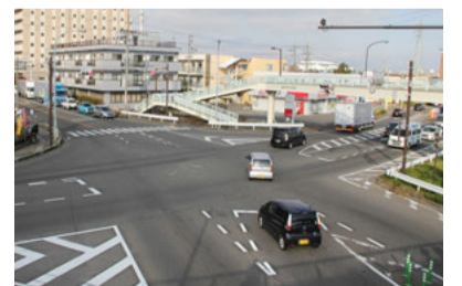
すぐ近くの「高出」交差点でも赤信号になってから交差点へ進入するクルマが多かった