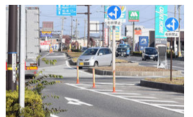
Dから来たクルマが★地点から逆走してAに向かっていた

「高出和手」交差点で発生した事故のほとんどはCから来たクルマが右折する際、Dから来た直進車と衝突するケースだ。ここは右折禁止になっているため、直進車が右折してくるクルマの存在を予測するのは難しい。そのため、右折禁止場所で右折することはたいへん危険な行為といえる。古いカーナビではCからBへの右折を誘導してしまうこともあるようだ。また、直進車の中にも信号が赤になってから交差点へ進入してしまうクルマが少なくなかった。ドライバーは道路標識や信号に注意を払うなど周囲の状況をよく観察するべきだ。