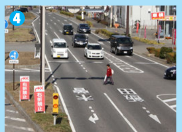
歩行者に近くにある歩道橋を利用するように促しているが、横断してしまう歩行者もいる