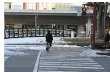
赤信号で横断歩道を通行する自転車

この交差点は見通しが良いため、自転車利用者は自分の存在をドライバーが見つけて、クルマのほうに止まってくれると思っているようだ。事故を防ぐために、信号機による自転車・歩行者とクルマの通行の分離も考えられる。また、信号を遵守しない自転車利用者もいることから、ドライバーに右折した先にある横断歩道上の自転車・歩行者の存在に対する注意喚起を促すための環境整備に期待したい。群馬県警察では今後、さらなる安全対策を検討していく考えだ。