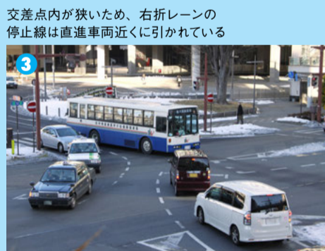
3 交差点内が狭いため、右折レーンの停止線は直進車両近くに引かれている