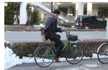
スマートフォンを操作しながら自転車に乗る高校生