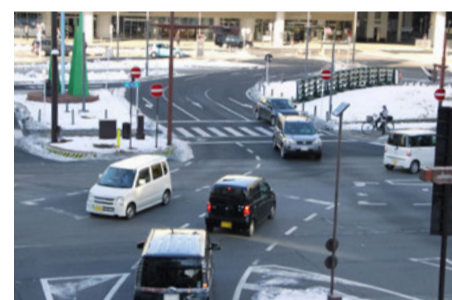
など右折待ちのクルマにとっては対向車の行く方向がわかりづらい状況となっていた。

駅から出てくるクルマは交差点直前にあるロータリーのカーブを抜けてくるためか、ウインカーを点滅させるタイミングが遅くなっていた。駅方向からの道路は左折・直進・右折のレーンに分かれているが、右折のレーンにいたクルマが交差点進入直前に直進に切り替える