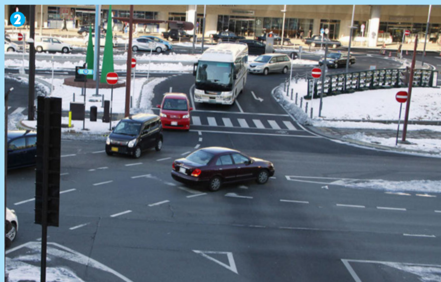
2 大型バスが直進してきているにも関わらず強引に右折する車両