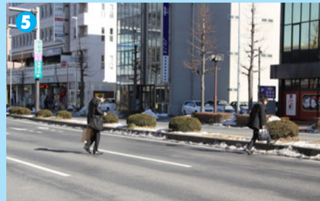
5 「栄町」交差点から倉賀野方面に100mほどの場所では、道路を横断する歩行者が目立った