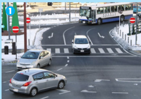
1 駅から出てくる車両が加速してきたので、右折直前に急停止した右折車両

今回訪れた「栄町」交差点はJR高崎駅東口のロータリーと、主要道路である県道12号、関越自動車道につながる県道24号が接続している。午前7時頃から通勤ラッシュが徐々に始まり、右折待ちのクルマが長い列を作っていた。歩行者の多くは駅から続く空中歩道を使うため、横断歩道を利用する歩行者は少ない。ただし、「栄町」交差点から倉賀野方面に100mほどの横断歩道のない場所で、歩行者がひんぱんに道路を横断していた。自転車利用者の多くは駅の駐輪場に向かっていった。