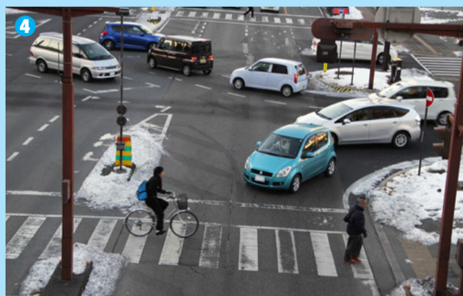
4 交差点内は左折・直進・右折の車両がそれぞれ進入するため、タイミングによっては非常に混雑する