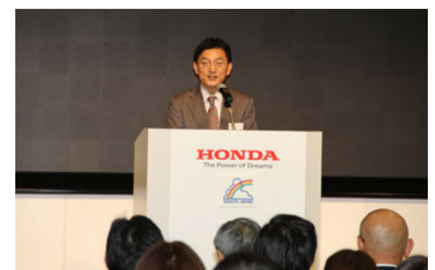
掛江浩一郎・警察庁長官官房審議官