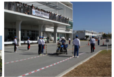
ブレーキングの部