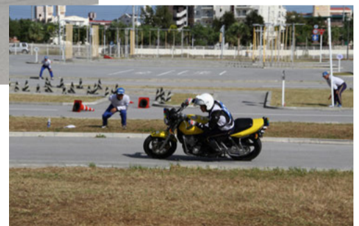
コーススラロームの部