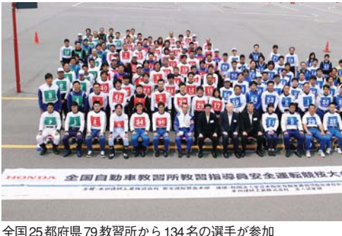
全国25都府県79教習所から134名の選手が参加