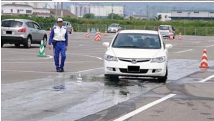
すべりやすい路面でABSの効果を実験