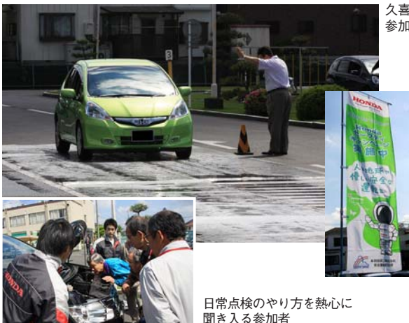
日常点検のやり方を熱心に聞き入る参加者

ホンダでは毎年、「春の全国交通安全運動(主催:内閣府ほか)」にあわせて、全国の販売会社(二輪・四輪)、全国7カ所の交通安全教育センター、ホンダ事業所及び関係会社のオールホンダで、春のサーフティキャンペーン(期間:4月28日~5月31日)を開催している。