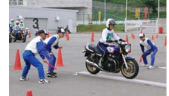
大型二輪部門「一本橋」

6月2日、3日の両日、鈴鹿サーキット交通安全センター(三重県鈴鹿市)で「第11回全国自動車教習所教習指導員安全運転競技大会」(主催:本田技研工業(株)安全運転普及本部)が開催された。この大会は、全国自動車教習指導員の自己研鑽への動機づけや、他の教習所との交流をめざし、日々の練習に励んでいる多くの教習指導員の方々の情熱と努力に報いなければならぬと