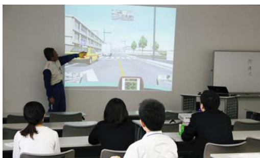
動画KYTを使って、様々な交通状況に潜む危険を知ってもら

ねらいです」と話す。この日は、同支社が管轄する四国4県の支店等から21名の社員が参加した。