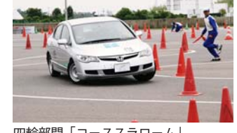
四輪部門「コーススラローム」