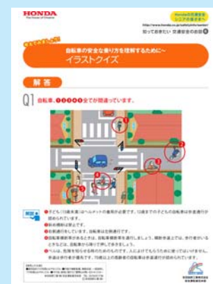
指導者に役立つ教材のダウンロードが可能

また、高齢者への交通安全指導を行う指導者の皆さまにも役立てていただけるよう、交通安全クイズや健康ドライブ体操などを紹介した教材のダウンロードが可能となっている。高齢者向け交通安全教室等、実際の教育現場でご活用下さい。