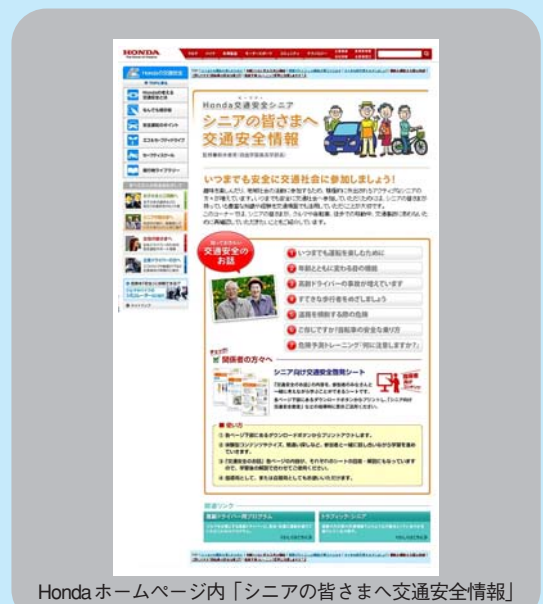
Honda ホームページ内「シニアの皆さまへ交通安全情報」

Hondaは、高齢者の交通事故防止に役立つ情報を掲載した、「シニアの皆さまへ交通安全情報」をホームページで紹介している。