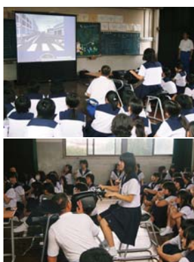
ライディングトレーナーを活用した危険予測トレーニング

原付と自転車の安全運転指導については、ホンダのインストラクターが担当。原付通学者と自転車通学者(徒歩・バス通学者も含む)に分かれて進められた。原付通学者にはライディングトレーナー(写真左参照)、自転車通学者にはホンダ自転車シミュレーターを活用。