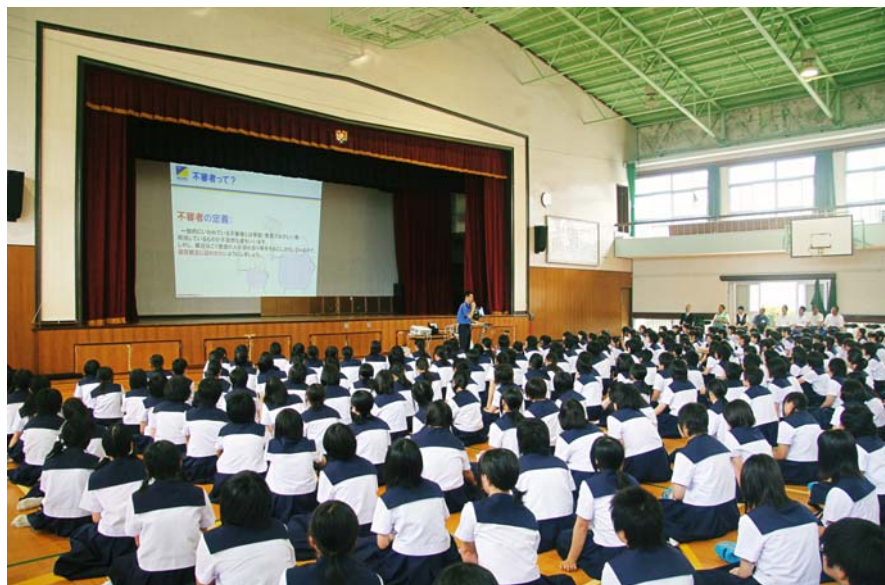
交通安全教室には鹿屋女子高校の生徒約600名が参加

7月2日、鹿児島県にある鹿屋市立鹿屋女子高等学校において、鹿児島総合警備保障(株)(鹿児島市)が主催する交通安全教室が開催された。鹿児島総合警備保障(株)は、鹿児島県教育委員会から「中・高校生交通安全教室」を開催された。