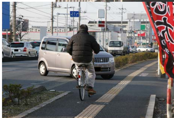
一時停止をせずに、歩道を走る自転車の前を横切るクルマ