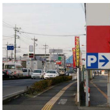
駐車場入り口の30m手前で合図をするクルマ

観察地点は埼玉県上尾市の国道17号線沿い。道路に沿って両側には商業施設が林立している。観察は、道路脇に駐車場がある複合商業施設2カ所、コンビニエンスストア、ガソリンスタンドの計4カ所の入り口付近で行なった。 観察の結果、入り口から30m手前の地点でウィンカーによる合図をしていたのは151台中56台(37.1%)。また、歩道の手前で一時停止を行ったのは、151台中20台(13.2%)だった。合図、一時停止とも行っていたのは、わずか11台(7.3%)だった。