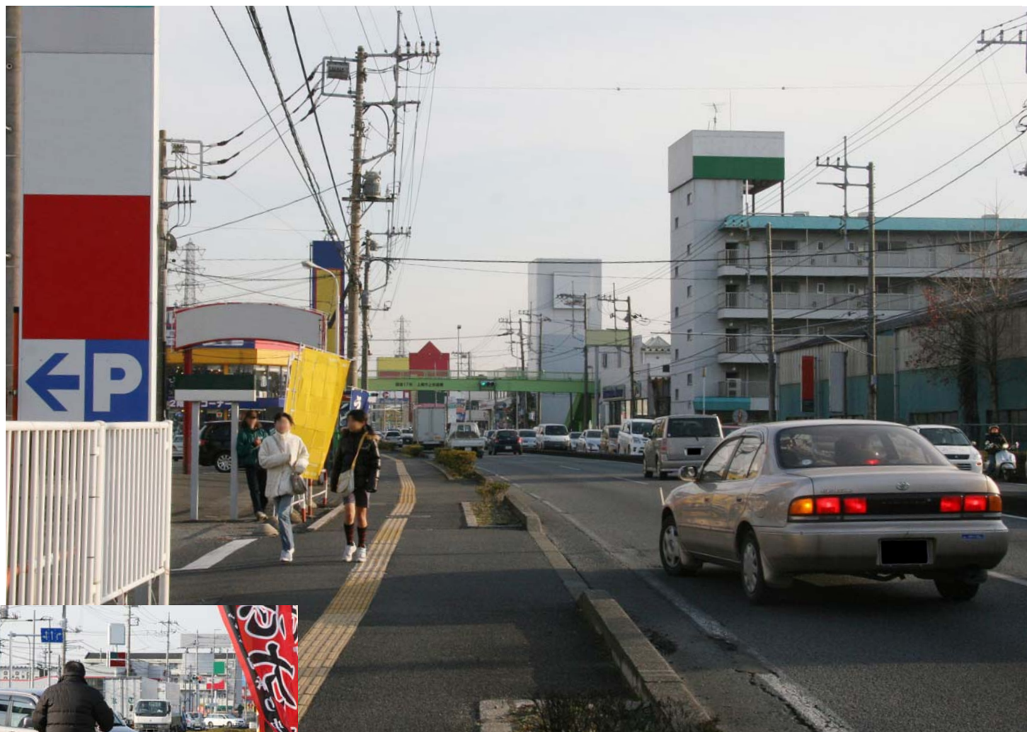
歩行者を見かけ、歩道に入る前に一時停止をするクルマ