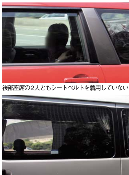
後部座席の2人ともシートベルトを着用していない