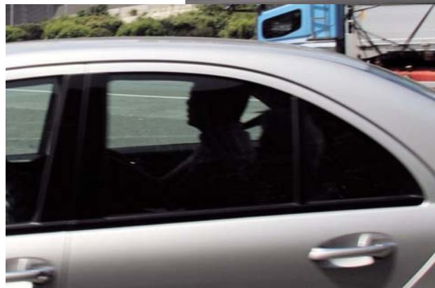
シートベルトを着用している後部座席同乗者

号に掲載したその結果は、小学生以上の後部座席同乗者392人中、シートベルトを着用していたのは13人(3.3%)だった。施行後、後部座席シートベルトの着用率は上昇したのだろうか。義務化されて2ヵ月半が経過した8月中旬、同じ場所で後部座席同乗者のシートベルト着用状