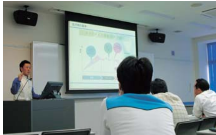
エコドライブの専門的知識を座学で確認