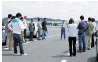
今までの車間距離は十分であったから自ら振り返る