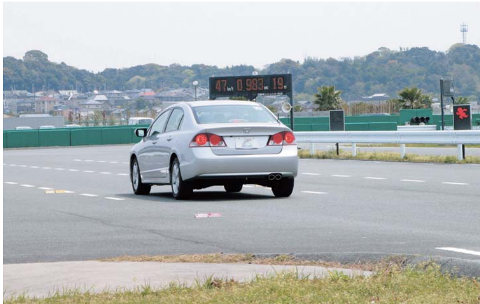
飛び出しなど緊急時を想定し、急ブレーキを体験