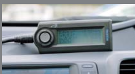
燃費マネージャー(燃費計)を車両に搭載し、燃費を計測