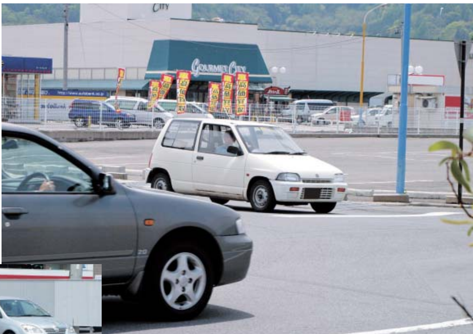
観察場所 / 長野県諏訪市沖田町5丁目付近 観察日 / 5月11日(水曜日) 天候 / 晴れ 観察時間 / 11:00 ~ 12:00(1時間) 観察者 / 4名