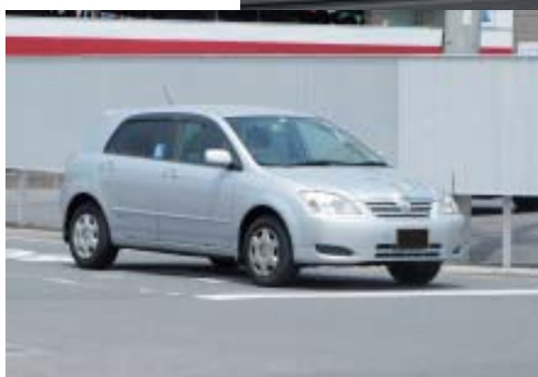
きちんと一時停止を行う初心者マークを付けたクルマ

10年で2.7倍に増加している。これは高齢者がクルマを運転、あるいは同乗する機会が増えていることと関係があるのである。事故類型別では出会い頭衝突が追突事故に次いで多く、25万1601件起