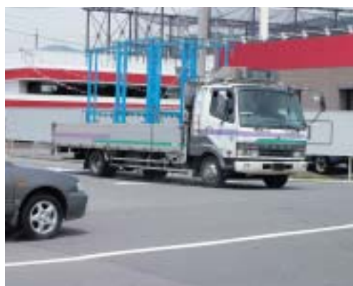
トラックは一時停止しない場合が多かった