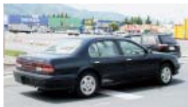
先行する左折車がいる場合、後についていき一時停止をしないクルマが多かった

観察の結果、観察地点を軽自動車100台、乗用車・トラック184台、二輪車2台、合計で286台が通過した。完全に一時停止を行ったのは286台中134台(46.8%)だった。残りの152台のほとんどは、見通しの良い交差点だったこととあり、事前に交差点側の状況を知り、停止線付近で減速して徐行するものもの完全には停止せず、徐行の状