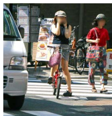
横断歩道上に自転車を止め、通話している女性

助手席に子どもを乗せた女性が運転中に携帯電話で通話を行っていたというケースも見られた。 自転車利用者の多くは信号待ちの間に携帯電話を使用していた。携帯電話をかけたながら片手運転で走行していた5名は全員20歳前後と見える若者だった。 歩行者の場合では、信号待ちで下を向いてメールをチェックする女性や若者が多かった。青信号になった時に携帯電話を見つめたまま歩き出したり、途中で急