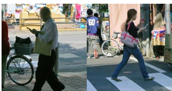
(左) 携帯電話を見ながら歩く年配の男性。携帯電話利用者の年齢層は広がっている (右) 携帯電話を見ている歩行者は周囲への意識が希薄になっているようだった