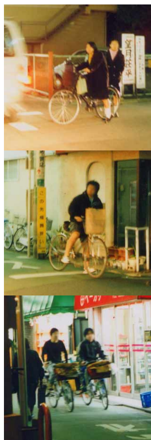
無灯火の自転車で走る人たち

観察場所は東京・杉並のJR荻窪駅から500mほどの地点にある商店街の中の小さな交差点。信号はなく、見通しはかなり悪い。この十字路には商店街の出入口方向に一時停止の標識と停止線の指示標識がある。交差する側の道路は一方通行となっているが、青梅街道側から自動車やバイク、自転車が進入してくる。観察時間は夕方5時20分から1時間、日没は4時35分で、5時を過ぎる頃には周囲は夕闇に包まれていて、灯火類を使用しないと見えにくい状況だった。 一時停止についてだが、停止線が確実に一時停止を行なったのは総台数255台中、わずか63台(24.7%)。このほとんどは、側方からクルマが接近してきたので停まったもので、自ら安全のために停止したようには思われなかった。まったくスピードを落とさずに交差点を通過する自転車もあり、ニアミスで急ブレーキをかける自転車も数台見られた。 安全確認は、左右をチラッと見る程度の自転車がかった。気になったのは3台〜5台と複数の自転車で交差点を通過した中高生とみえる学生たちで、集団で一時停止せずに通過し、さらに交差点内で立ち話をしていた。 一方、灯火についてだが、日没を過ぎていたにもかかわらず自転車のライトを点灯していたのは255台中101台(男性42台・女性59台)で4割程度。残りの154台のうち灯火装置が装着されていないか、自転車のライトが暗い、若年層ほど点灯率が低下してしまっていた。買い物帰りの母親らしき女性と幼稚園