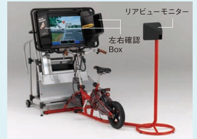
Honda 自転車シュミレーター