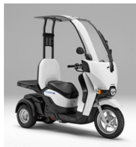
GYRO CANOPY e: