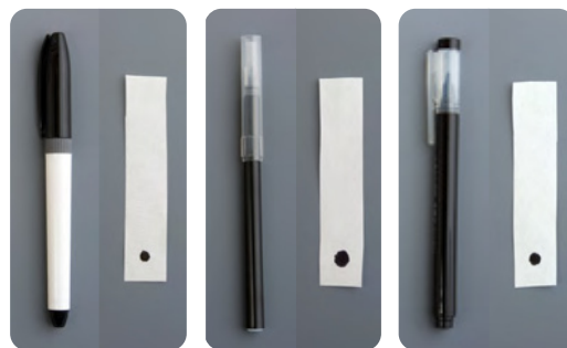
メーカー A メーカー B メーカー C

黒の水性ペンのインクを、ほそ長く切ったコーヒーフィルターのはしにつけて、水をしみこませ、インクをにじませてしらべる。ペンによってちがいがあるかもしれないので、ペンは何種類か用意した。