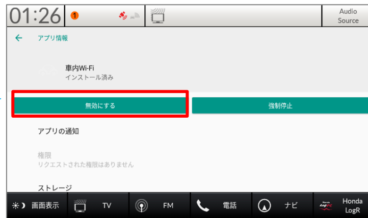
⑤「無効にする」を押下