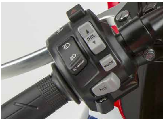
■CBR1000RR SP 左スイッチボックス ※写真は輸出仕様車です。