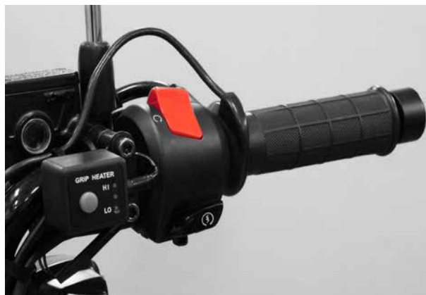
■グリップヒーター

冬期や気温変化の大きな長距離ツーリングなどで、ハンドルを握る手の冷えを軽減します。