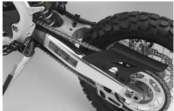
■スイングアーム (写真は海外仕様車)

チェーンカバーを装備し公道での使用に適合させました。スイングアーム内部にウレタンフォームを注入するとともにチェーンライダーの形状を最適化することで、走行時の騒音を低減し静粛性に寄与しています。