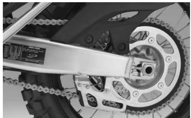
■ドリブンスプロケット (写真は海外仕様車)

スプロケットは、前後にモリスダンパーを採用し静粛性に寄与しました。ドリブンスプロケットにはより耐久性の高いスチール材を採用しています。