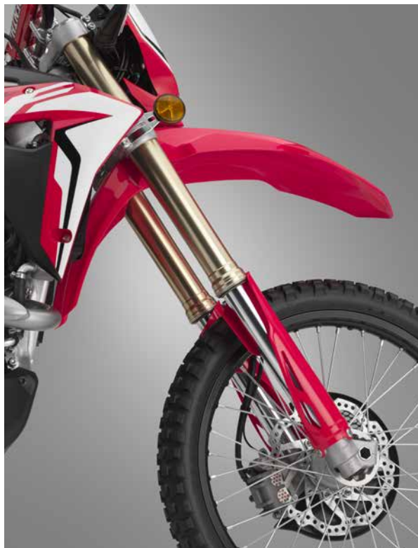
■フロントサスペンション回り(写真は海外仕様車)

また、リザーブタンク容量をアップし、ブレーキスイッチ、サイドミラーステーを一体化したフロントブレーキマスターシリンダーを専用設計しました。