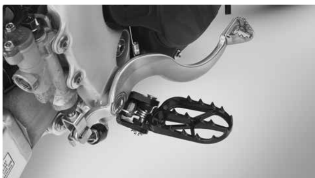
■ステップ R側 (写真は海外仕様車)