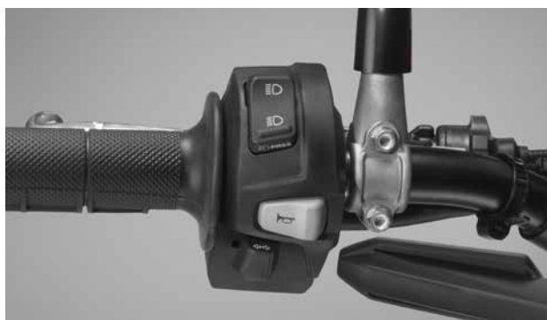
■左側ハンドルスイッチ (写真は海外仕様車)

オフロード用に最適化した小型軽量のハンドルスイッチを専用設計。 公道仕様に必要なスイッチ類を最適な位置に配置することで、オフロードでの扱いやすさに寄与しています。