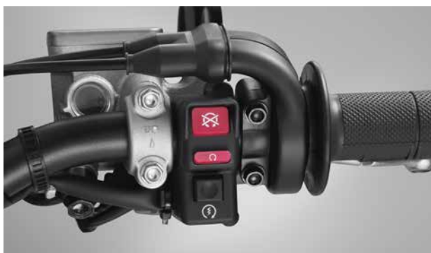
■右側ハンドルスイッチ (写真は海外仕様車)