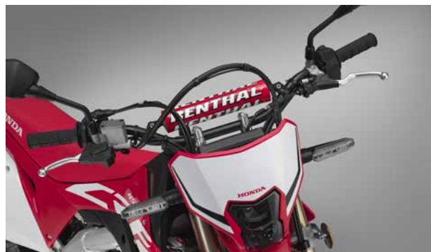
■ハンドルバー (写真は海外仕様車)

ハンドルバーは、スタイリングを引き締めるレンサル社のブラックハンドルと、車体色にマッチするレッドのハンドルパッドを採用。