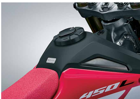
■キー付きフューエルタンクキャップ