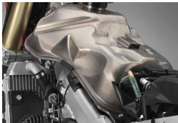
■チタン製フューエルタンク(写真は海外仕様車)

容量7.6Lのチタン製フューエルタンクを採用。2018年型モデルCRF450X(樹脂製)に対し、容量を0.4L増加させつつ406g軽量化。また、2018年型モデルCRF450R(チタン製)に対し、法規対応と容量を1.3L増加させながらも、重量増を354gにとどめました。耐久性向上とともに航続距離を伸ばすことで、トレイルからトレイルへ公道を使った走行に対応しました。