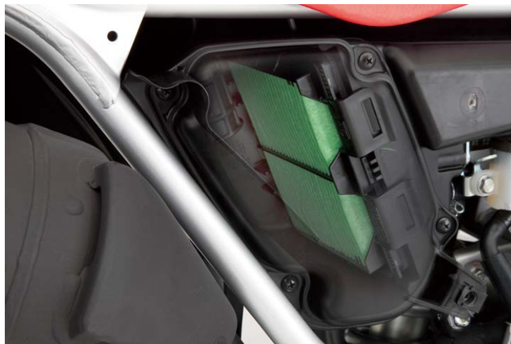
プロトタイプ撮影 CG による合成画像