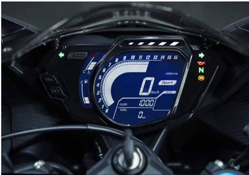
■フルデジタルメーター

メーター左に配置したハードキースイッチを押すことで、トリップ、時計、ラップ計測モードなど切替えの他、メーター輝度の調節などを行います。