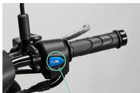
スタータースイッチ