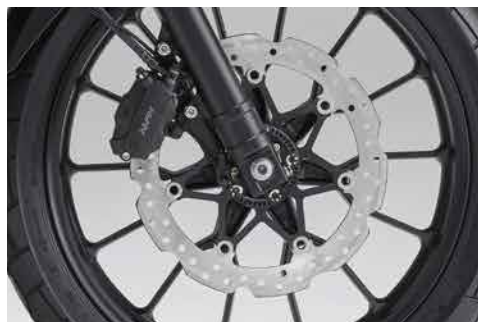
■フロントブレーキまわり

フロントにφ310mmのフローティングディスクを採用。リアブレーキは液圧レシオを含めてセッティングを見直し、穏やかな効力とする事で、フラットダートを含めた様々な路面でのブレーキコントロール性を向上。制動時の安心感をさらに高めました。