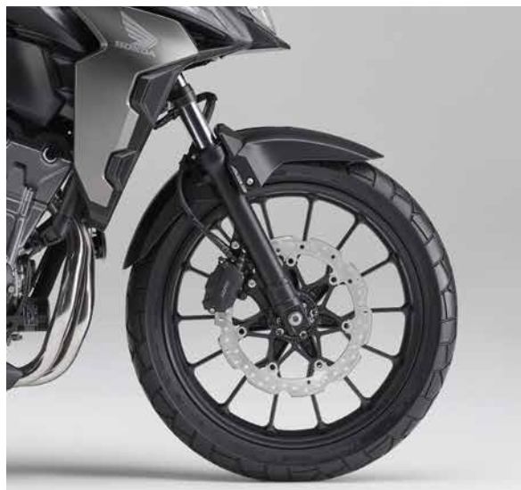
■フロントホイールまわり

従来モデルに対し、リアホイールトラベルを10mm長く設定。それにより、タフなイメージを増したデザインに見合った走破性能を獲得。また、全屈タフネス性を高め、乗り心地の向上にも寄与しています。