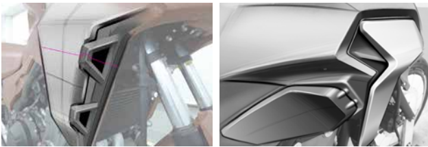
■シュラウドまわり(イメージCG/スケッチ)

フロントカウルまわりの造形をさらにタフなイメージに進化させるために、ラジエーターシュラウドを大型化。シュラウドまわりのレイヤードデザインやインテーク機能を強調したサイドカバーは、ライダーの足に当たる走行風とラジエーターからの排風を効果的にコントロールする事で、快適性も高めました。