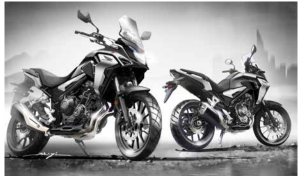
■イメージスケッチ

クロスオーバーモデルらしい、冒険心を駆り立てる、タフなイメージを持ったスタイリングとしました。