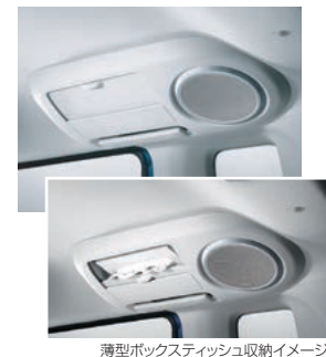
薄型ボックスティッシュ収納イメージ

コンソール付きの17cmスピーカーをルーフ左右に設けました。スピーカーの位置が高いため音の広がりがよく、臨場感豊かなサウンドが楽しめます。また、ベッドモードでもボードに隠れることなく、普段通りのクリアな音質です。コンソールは薄型ボックスティッシュがすっぽり収納できる容量を確保。シャッター式リッドを装備しており、使わないときはすっきりした見え方になります。十分な耐荷重のフックバーを備えており、S字フックを使ってランプを吊したり、キャンプ時などは左右にロープを渡して洗濯物を干したり、さまざまな用途に活用できます。