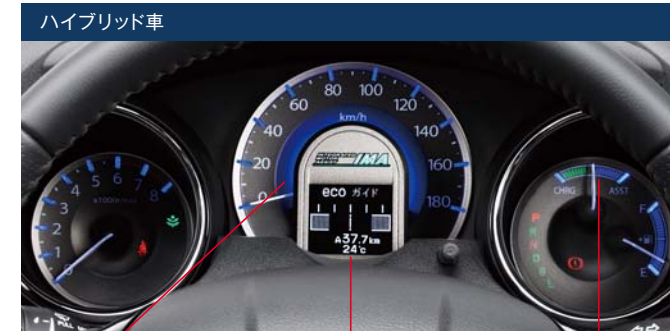
ハイブリッド車 アンビエントメーター マルチインフォメーションディスプレイ モーターアシスト/チャージ表示

各メーターを明確にゾーン分けし、常時点灯式とした視認性のよいメーター。目盛りや表示をホワイト照明とし、メーターリングにメッキを施すことで、上質感を演出しています。また、ハイブリッド車は、照明