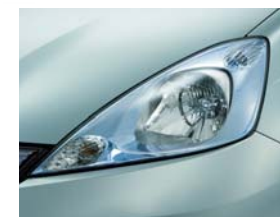
メッキにクリアブルー塗装を施し、クリーンイメージを持たせたヘッドライト &リアコンビネーションランプ