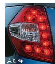
メッキハウジング、 LEDを採用した リアコンビネーション ランプ

ボディサイドからなめらかに絞り込むとともに、傾斜を強めたリア ウィンドウが軽快なイメージを創出。リアフェンダーまわりの 立体的な造形と大型のリアコンビネーションランプが 安定感と存在感を生み出しています。