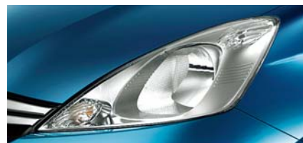
メッキガーニッシュを採用したヘッドライト

メッキを大胆に施したワイドで立体感あふれるフロントグリルと大型でシャープな形状のヘッドライトに一体感を持たせ、存在感のある表情を実現。また、厚みのあるバンパーは両サイドのロア部が張り出したエアロ形状とし、低重心で安定したイメージをつくり出しています。