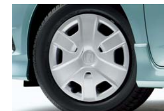
空力特性に配慮した専用ディッシュ スポークタイプフルホイールキャップ