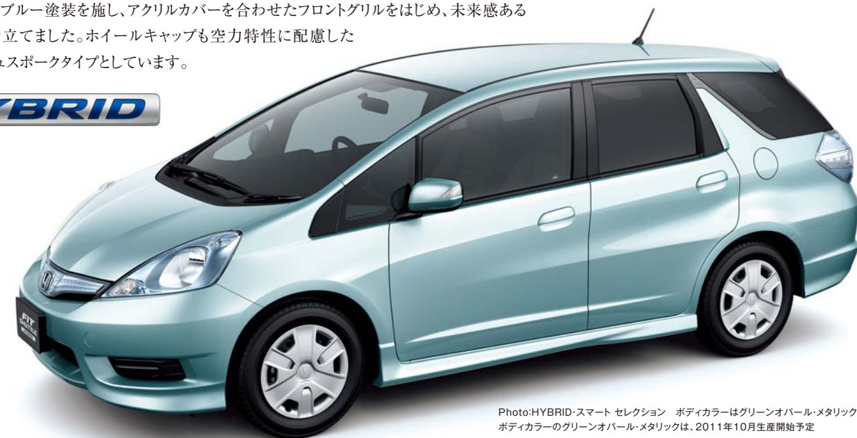
Photo:HYBRID・スマート セレクション ボディカラーはグリーンオパール・メタリック ボディカラーのグリーンオパール・メタリックは、2011年10月生産開始予定