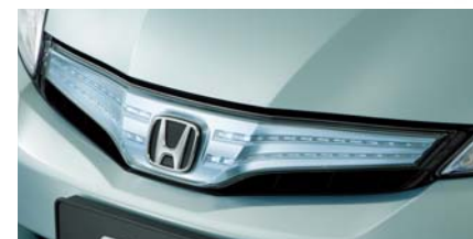
メッキにクリアブルー塗装を施し、アクリルカバーを 合わせたフロントグリル。ヘッドライトとの一体感を強め、 独自性のある表情とワイド感を表現