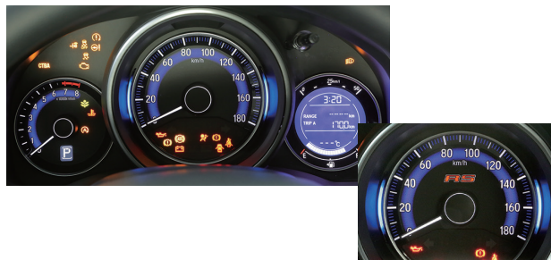
RSロゴ入りメーター

目盛りや数字を大きくし視認性を高めたスピードメーターを中心に、ブルー基調のクリーンなデザインで先進性を表現しました。インフォメーションディスプレイは、スピードメーターから独立させて大型化し、時計や外気温*1を常に表示しながら、瞬間燃費などさまざまな情報を確認することができるようにしました。照明色の変化によってエコドライブ度を知らせるアンビエントメーターも備えています。