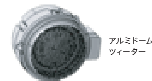
アルミドームツイーター

振動板に金属材質のアルミニウムを、マグネットはネオジウムを採用。高い伝搬速度と適度な内部損失により、広がりのあるクリアな音を再現します。