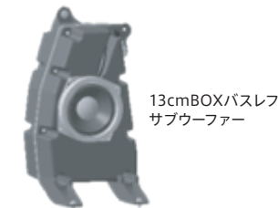
13cmBOXバスレフサブウーファー

スピーカーユニットから出る低音の位相を反転させることで低域を増強するバスレフ仕様とし、小容量でも迫力のある低音を再生します。