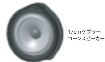
17cmケブラーコーンスピーカー

振動板に、高級スピーカーに使われるケブラー（有機繊維）を採用したケブラーコーンスピーカーを採用。ペーパーコーンスピーカーよりも優れた伝搬速度と弾性率で、リニアでレスポンスが良く、歪みのない音を再現します。