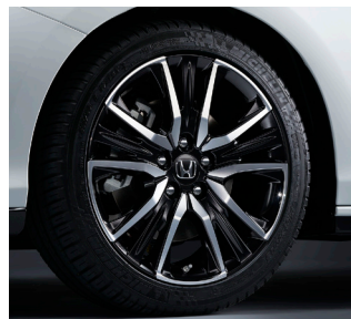
ペルリナブラック塗装 19インチ ノイズリデュースアルミホイール