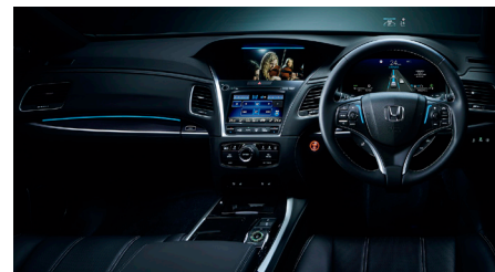
Honda SENSING Elite 表示灯 (ステアリング、ナビ画面*上部、グローブボックス)