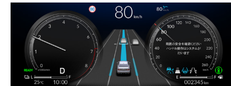
12.3インチ フル液晶グラフィックメーター