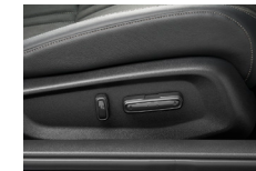
運転席側操作レバー

運転席には、スライド、リクライニング、高さ（前・後）を電動で調節できる8ウェイパワーシート、助手席には、スライドとリクライニングが電動で調整可能な4ウェイパワーシートを設定しました。 ※EX・EX・BLACK STYLE に標準装備