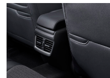
運転席&助手席シートバック スマートフォンポケット