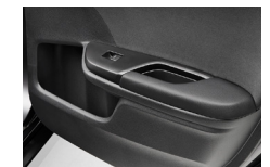
リアドアポケット (ボトルホルダー付)