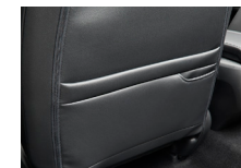
助手席シートバックポケット