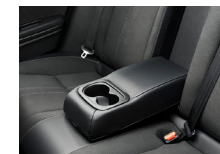
リアセンターアームレスト (ドリンクホルダー付)