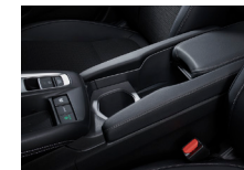
センターコンソールボックス