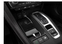
大型コンソールトレイ