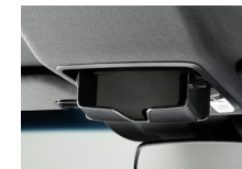
サングラスホルダー