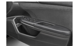
フロントドアポケット (ボトルホルダー付)