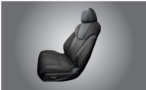
■ヒーターマット配置イメージ図