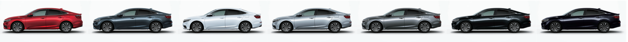
プレミアムクリスタルレッド・メタリック