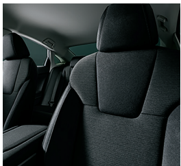
ファブリックシート(LX)

メイン部にナチュラルな風合いの素材を採用し、サイド部には艶のある滑らかな生地を配した、上質でベーシックなコーディネート。*サイド部に施したステッチラインが洗練された印象を与えます。