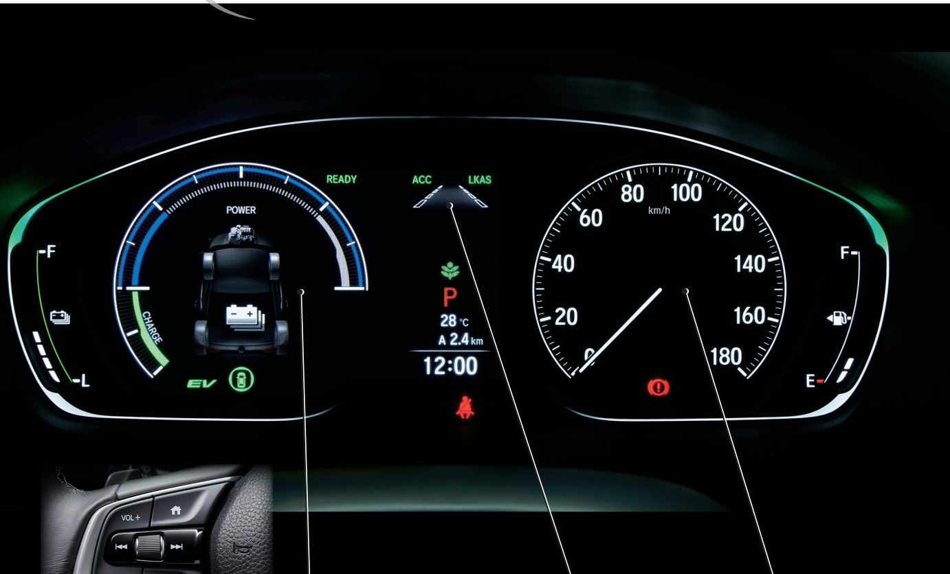
ステアリングスイッチ

ロータリー式の「セレクト/ENTER」スイッチの採用により、マルチインフォメーション・ディスプレイがより直感的に操作できるステアリングスイッチを装備しました。いつでもホーム画面に復帰できる「ホーム」スイッチを備え、使いやすさを大幅に向上させています。