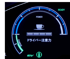
ドライバー注意カモニター

ドライバーのステアリング操作に応じて、居眠り運転や不注意運転を検知。メーター内に運転者注意カレベルを表示し、警告音とステアリングの振動で休憩を促します。