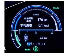
航続可能距離/平均燃費