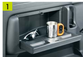
ビルトインテーブル(タイプ別設定)

ルーフに近い側面上部の左右2カ所にフックを設置しました。タイダウンフックと合わせて荷物の固定などに利用できます。