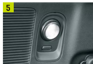
カーゴスポットライト(角度調節機構付)(タイプ別設定)