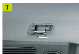
ユーティリティフック(左右)

■タイプ別設定については、カタログをご参照ください。■テーブル・トレイ等は、荷物のサイズ・形状により使用できない場合があります。安全のため、走行の際は使用しないでください。■小物類は撮影のために用意したものです。