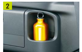
ドリンクホルダー(タイプ別設定)