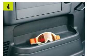
サイドライニングトレイ(左右)