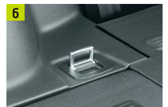
タイダウンフック(4カ所)