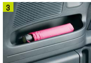
リアサイドポケット(左右)