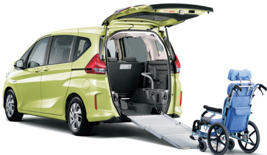
フリード+ 車いす仕様車 乗車定員6名（通常時5名 / 車いす乗車時6名）

2列シート車のフリード+には、このクルマの基本コンセプト「いつでも、どこでも、だれでも」を実現するための具体的な形のひとつとして、ハイブリッド車 / ガソリン車ともに車いすのまま乗り込める車いす仕様車をご用意しています。ただし、車いすでの乗車を可能にするために、クルマの基本骨格などを大きく変えたわけではありません。フリード / フリード+は、さまざまなユーザーの皆さまに、それぞれの快適さをお届けするために必要なスペースや機能 / 性能をクルマづくりの第一歩から追求して生まれたクルマ。車いすを特別扱いにするのではなく、介護が必要な方もそうでない方もわけ隔てなくおもてなしすることを、車体設計の段階から念頭に置いてクルマづくりを進めた成果です。