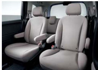
2列目キャブテンシート両側アームレスト (フリード(6人乗り)/外側はタイプ別設定)