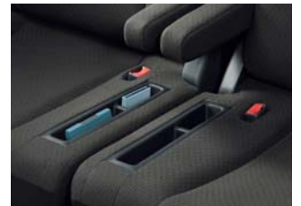
3列目中央に左右席とも座面ポケットを 装備。柔らかい素材でつくり、停車中にお 子様が寝転がれるよう配慮しました。 (フリード)