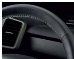
本革巻ステアリングホイール (タイプ別メーカーオプション)