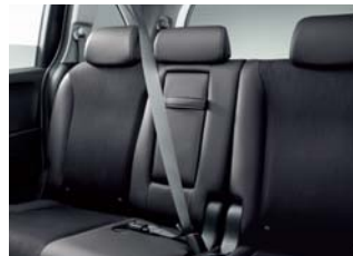
2列目タンブルシート格納式 センターアームレスト(フリード(7人乗り))