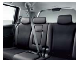
全席ヘッドレストおよび 3点式シートベルト