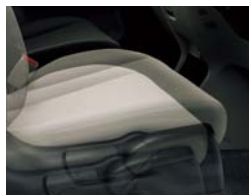
運転席ハイトアジャスター