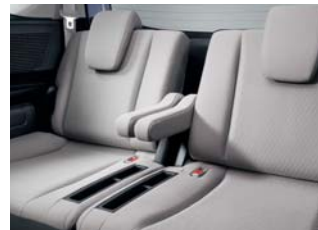
3列目独立型センターアームレスト (フリード)