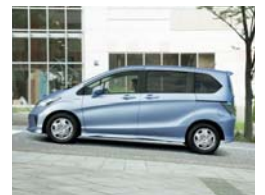
VSA (ABS+TCS+横すべり抑制) ヒルスタートアシスト機能