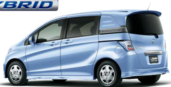
Photo : フリード スパイク Hybrid