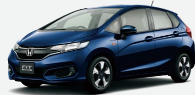
Photo:HYBRID (FF) ボディーカラーはミッドナイトブルーベーム・メタリック 写真のミッドナイトブルーベーム・メタリックは33,000円高となり、表示価格には含まれておりません。