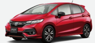
Photo:RS-Honda SENSING (FF/6MT) ボディーカラーはプレミアムクリスタルレッド・メタリック 写真のプレミアムクリスタルレッド・メタリックは55,000円高となり、表示価格には含まれておりません。