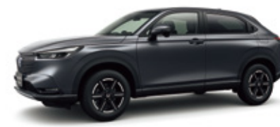
Photo: FF ボディーカラーはメテオロイドグレー・メタリック 写真のメテオロイドグレー・メタリックは38,500円 (消費税抜き 35,000円)高となり、表示価格には含まれておりません。