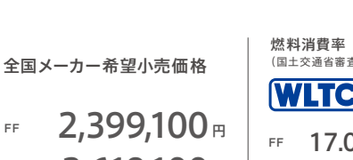
Photo: FF ボディーカラーはプレミアムサンライトホワイト・パール 写真のプレミアムサンライトホワイト・パールは60,500円 (消費税抜き 55,000円)高となり、表示価格には含まれておりません。