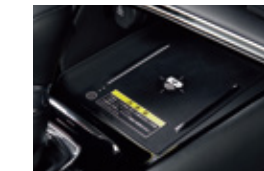
ワイヤレス充電器 G、e:HEV X、e:HEV Zにメーカーオプション