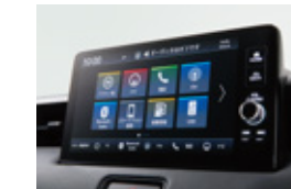
Honda CONNECTディスプレイ+ETC2.0車載器(ナビゲーション運動) G、e:HEV X、e:HEV Zにメーカーオプション