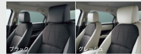
コンピシート (プライムスムーズ×ファブリック) *ボディーカラーによっては、インテリアカラーのグレイージュはお選びいただけません。

燃料消費率 (国土交通省審査値) WLTCモード FF 24.8 km/L 4WD 22.0 km/L