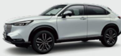
Photo: FF ボディーカラーはプレミアムサンライトホワイト・パール 写真のプレミアムサンライトホワイト・パールは60,500円 (消費税抜き 55,000円)高となり、表示価格には含まれておりません。