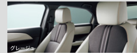
コンピシート (プライムスムーズ×ファブリック)