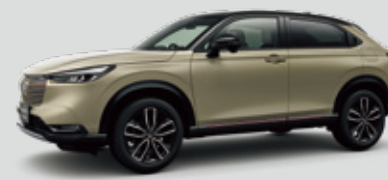
Photo: ボディーカラーはサンドカーキ・パール&ブラック 写真のサンドカーキ・パール&ブラックは27,500円 (消費税抜き 25,000円)高となり、表示価格には含まれておりません。