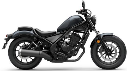
車体色: マットディムグレーメタリック