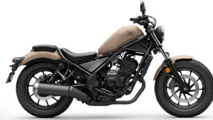
車体色: マットプレスコブラウン