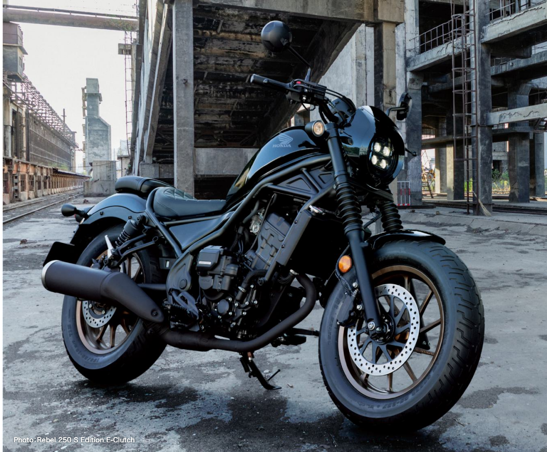
Photo:Rebel 250 S Edition E-Clutch

※ABSはライダーのブレーキ操作を補助するシステムです。ABSを装備していない車両と同様に、コーナー等の手前では十分な減速が必要であり、無理な運転までに対応できません。運転するときは急なブレーキ操作を避け、安全運転をお願いします。ABS作動時は、キックバック(揺り戻し)によってシステム作動を知らせます。