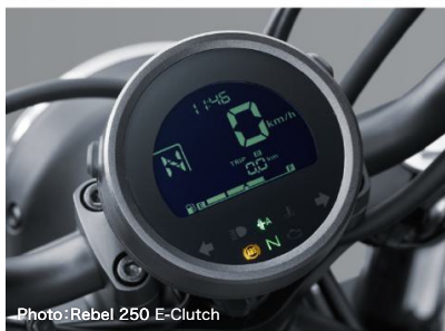
Photo:Rebel 250 E-Clutch