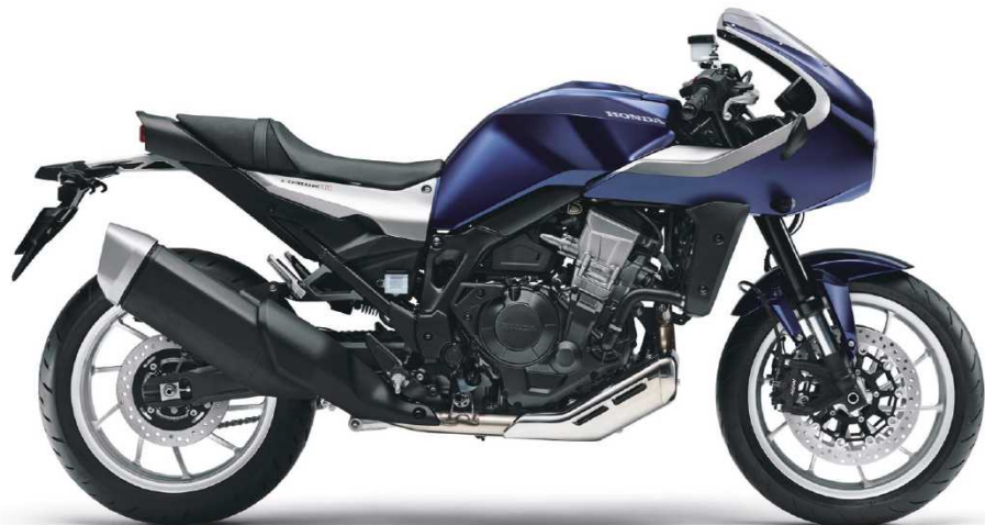
車体色:パールホークスアイブルー