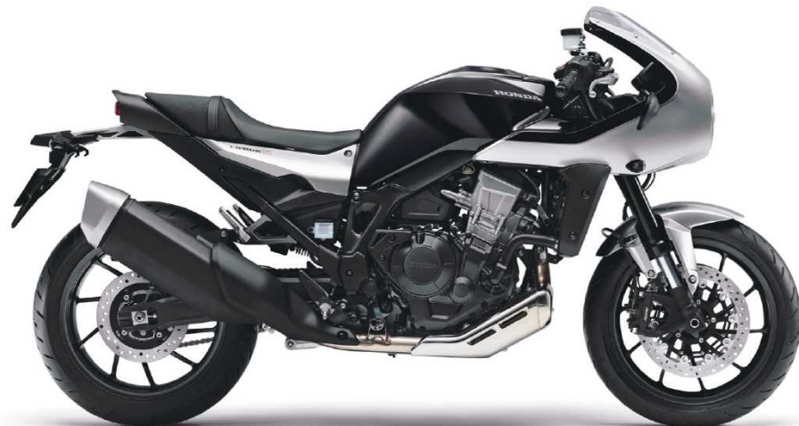
車体色:グラファイトブラック