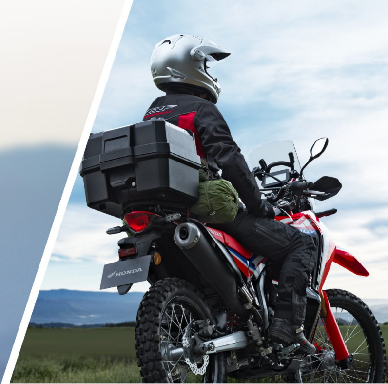
Photo: CRF250 RALLY (s) ※写真はアクセサリ装着車です。 (装着アクセサリ: アクセサリーソケット、スポーツ・グリップヒーター、トップボックス 38L: ワン・キー・システムタイプ、リアキャリアサポート、キャリアブラケット) ※写真の小物類は撮影のために用意したものです。