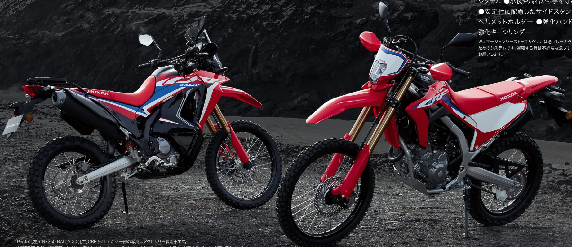
Photo: [左]CRF250 RALLY (s)、[右]CRF250L (s) ※一部の写真はアクセサリ装着車です。 (CRF250 RALLY装着アクセサリ: アクセサリーソケット、スポーツ・グリップヒーター、リアキャリアサポート、キャリアブラケット) CRF250L装着アクセサリ: スキッドプレート、アクセサリソケット、ラリーステップ)

※エマージェンシーストップシグナルは急ブレーキをいち早く後続車に伝えるためのシステムです。運転する時は不必要な急ブレーキを避け、安全運転をお願いします。