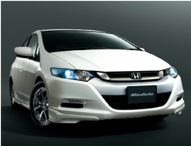
「インサイト」ディーラーオプション装着車 スタイリング

またインテリアは、運転手や同乗者の体をしっかりとホールドし、スポーティな走りを支えるRECARO®社製スポーツシートを、よりホールド性に優れた『スポーツタイプ』に加え、ヒップサイド部の高さを抑え、乗降性にも考慮した『フラットタイプ』の2種類設定している。